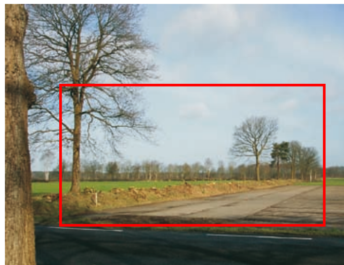
Gekapte houtwal tussen Wapse en Vleder.

Steeds vaker valt het op dat rondom de velden waar het volgend jaar lelies gaan komen, de houtwallen rigoureus worden gesnoeid. Een veld waar de wind ongehinderd kan waaien en waar weinig schaduw valt, is voordelig voor de lelieteelt vooral als de zomers nat zijn. Met deze, vaak niet gemelde, bomenkap wordt het aanzien van het Drentse landschap ernstig aangetast.