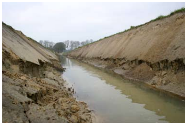
Voor de afwatering van een akker voor de lelieteelt is door de Maatschappij van Weldadigheid zonder vergunning deze sloot gegraven in het beekdal van de Wapserveense Aa

Tijdens het maken van deze nieuwsbrief is er nog geen tastbaar resultaat geboekt. Wel zijn er afspraken om met het bestuur van de Maatschappij van Weldadigheid te spreken. De gemeente heeft slechts een standaardbrief als antwoord teruggestuurd. Wordt vervolgd!