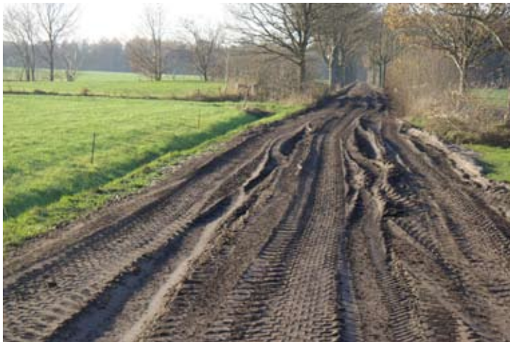
Stukgereden weg in Vledderveen

Verontruste omwonenden van een lelieteeler in Vledderveen, verenigd in de werkgroep 'Vledder natuurlijk', vragen momenteel aandacht voor de vele transportbewegingen als gevolg van de lelieteelt. De smalle wegen in het buitengebied zijn niet op de brede landbouwvoertuigen berekend en worden onevenredig zwaar belast. Omwonenden ondervinden hinder van de vele transportbewegingen over de smalle wegen, waarbij soms gevaarlijke verkeerssituaties ontstaan. Bermen worden kapot gereden en beeldbepalende oude bomen langs de smalle wegen raken met regelmaat zwaar beschadigd waardoor ze dood gaan en gekapt moeten worden. Zandwegen in de omgeving worden zwaar beschadigd, niet tijdig gerepareerd en zijn soms maandenlang onbegaanbaar voor wandelaars. In de milieuvergunning van het lelieteeltbedrijf staat niets over het aantal transportbewegingen van de speelplaats. Dit is niet verplicht maar mag wel door de gemeente in de vergunning worden opgenomen. Hieruit blijkt dat de gemeente deze lelieteeler geen strobreed in de weg legt. De gemeente Westerveld heeft inmiddels wel toegezegd de situatie rond de Middenweg in Vledder te onderzoeken en waar nodig de weg (lokaal) te verbreden, waarbij de oude bomen worden ontzien. De lelieteeler heeft er o.a. vanwege negatieve aandacht in de pers afgezien van het bouwen van een biogasinstallatie en een grote bloemenkas op het voormalige NAM terrein in Vledderveen.